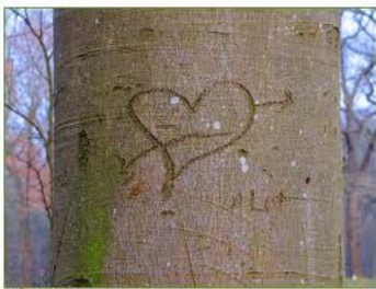
Op een bankje in het woud, stond geschreven in het hout, hoeveel ik van je hou...

Met Valentijnsdag geven geliefden elkaar extra aandacht. Blijft een liefdesverklaring, anoniem geschreven op een boom, daar eeuwig bewaard ? Wordt de liefdesdrift aangewakkerd door sommige kruiden uit het bos ? Welke planten wonen onder hetzelfde dak? Onder welke boom verklaar je je liefde het best ? Of welke boom plant je voor je uitverkorene ? Welke struik zorgt ervoor dat je hartje sneller gaat slaan ? Welke planten in het bos hebben zich onafscheidelijk aan elkaar gekoppeld ? In welke boom huist de godin Freya ? Zij die liefde en vruchtbaarheid scheidt ! Welke dieren krijgen kriebels vanaf Valentijnsdag ? Een liefdesdrankje maakt deze wandeling compleet ! (extra kostprijs, op aanvraag)